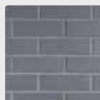
Brics peirianeg glas

Rhowch eich barn ar ein cynlluniau - gallwch chi roi eich adborth yn y digwyddiad hwn neu drwy ein gwefan: www.horizonnuclearpower.com/ymgyngoriad