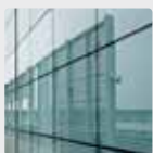
Waliau llen wydr

Mae enghraifft o'r paletau deunyddiau rydyn ni wedi'u creu yn cael eu dangos yn y canlynol: